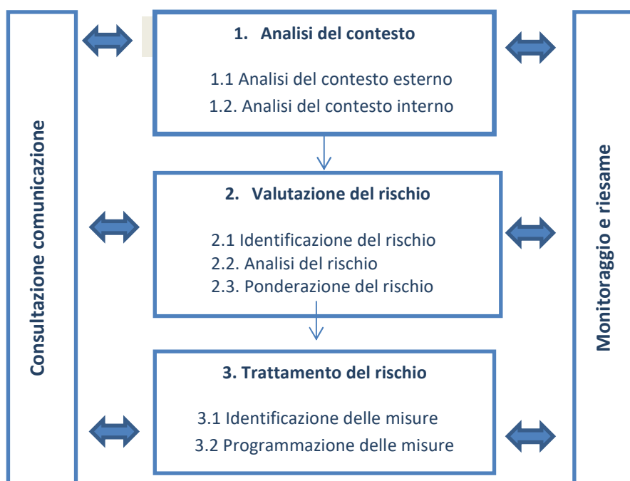
Figura 1 - Il processo di gestione del rischio di corruzione

Il processo di gestione del rischio di corruzione si articola nelle fasi sintetizzate nella figura 1 che segue ed è dettagliato nei successivi paragrafi.